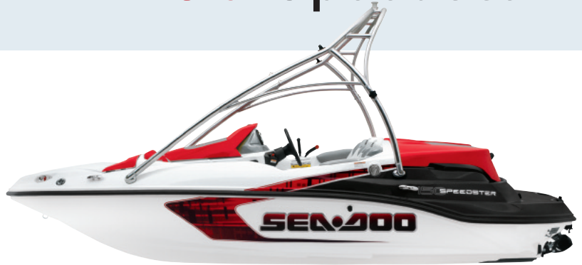
L'illustration montre le 150 Speedster avec la tour en option